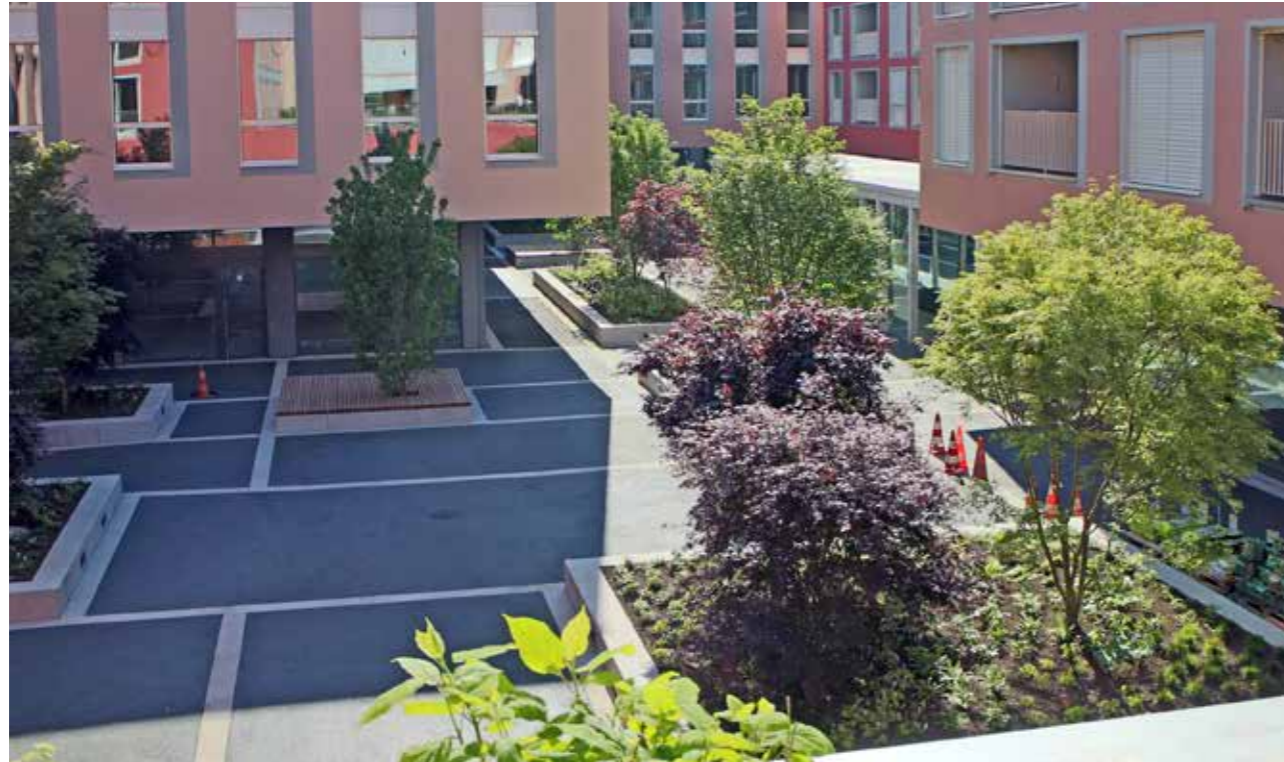
Ineinanderfliessende hofartige Aussenräume