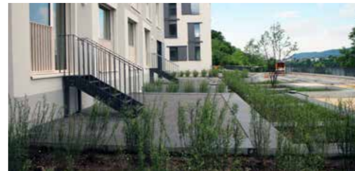
Wohnen am Fluss