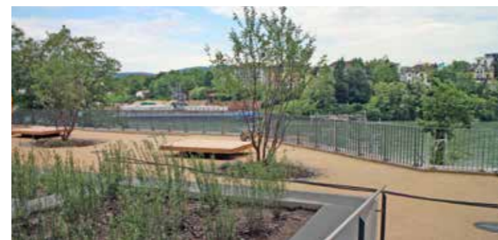
Neue Aufenthaltsqualität am Ufer