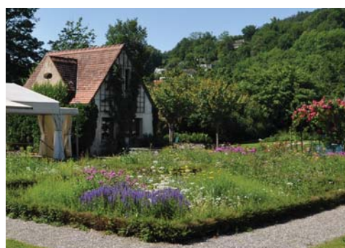
Gartenhäuschen mit Rosen- und Zierbeeten