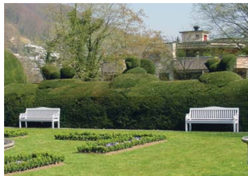
Eibenhecke mit Topiary-Schnitt in Vogelform