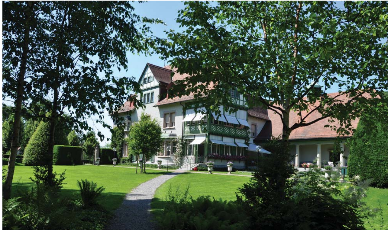
Garten der Villa Langmatt als Ausstellungsort ausgewählter Kunstwerke