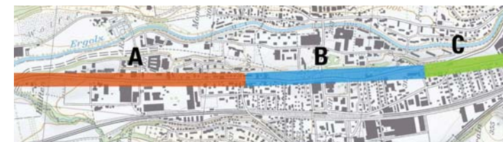
Teilabschnitte der Rheinstrasse, welche durch die Arbeitsgruppen bearbeitet werden