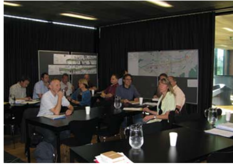
Impressionen aus den Arbeitsgruppen