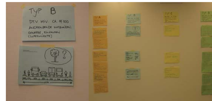
Ergebnisse der einzelnen Arbeitsgruppen