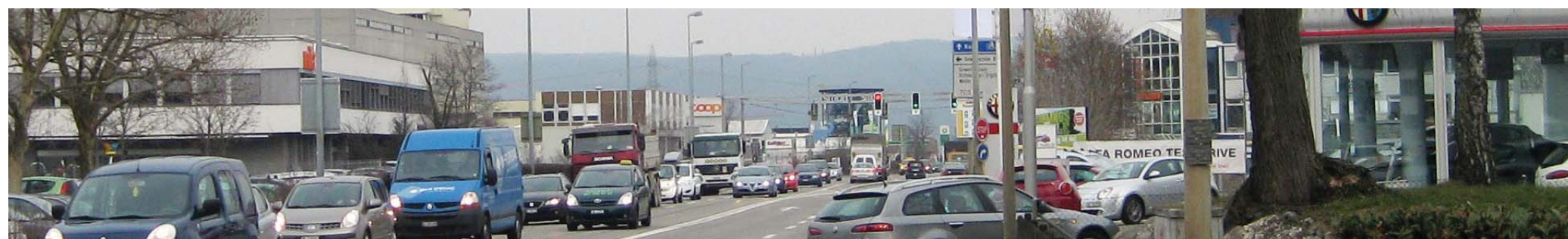
Die unterschiedlichen Nutzergruppen haben differenzierte Ansprüche an die Rheinstrasse