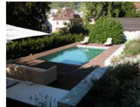
Badegarten nach der Umgestaltung