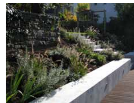
Staudenpflanzung zum oberen Garteniveau