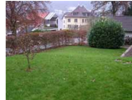
Garten vor der Umgestaltung