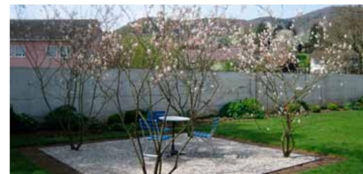
Der neue Sitzplatz wird beschirmt von Felsenbirnen