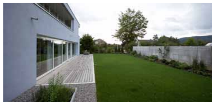
Das geradlinige, introvertierte Konzept passt zur Architektur des Hauses