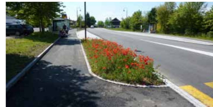
Bewusstes Loslösen des Gehweges von der Strasse auf der linken Seite