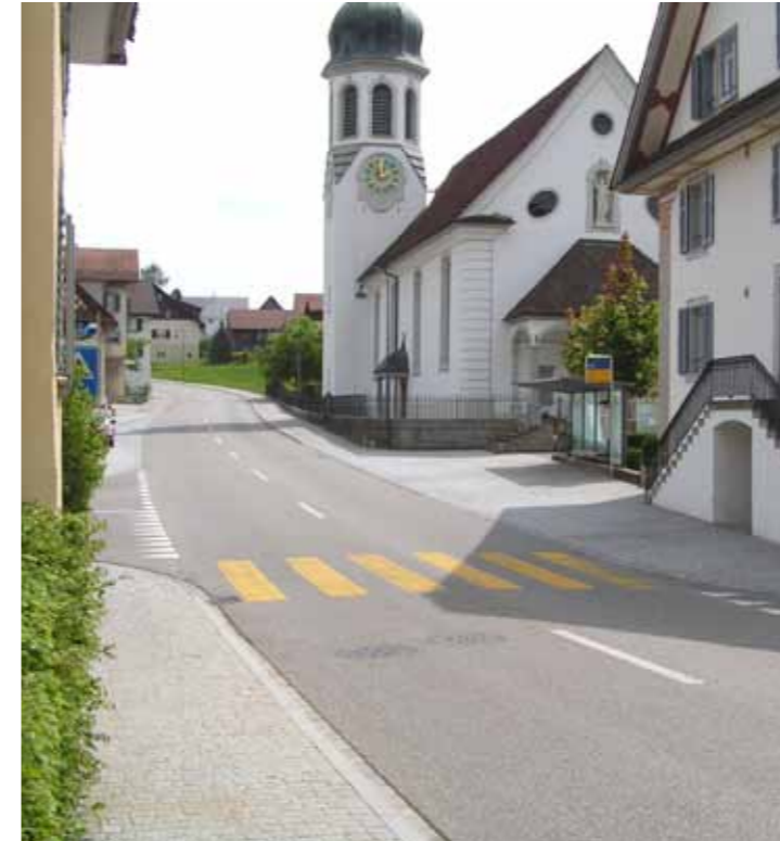
Postplatz mit Vorbereichen zu Kirche und Zentrumsbauten