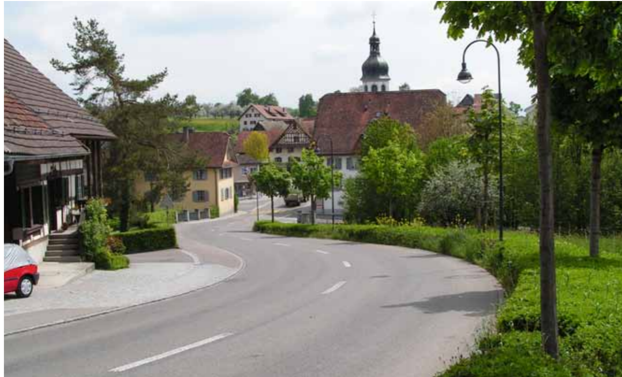
Ausbauetappe mit verkehrsführenden Elementen