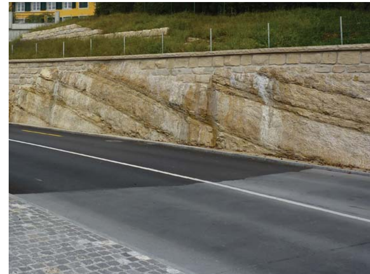
Sichtbarmachen des Felsens, Natursteinausfachungen in verwitterten Bereichen