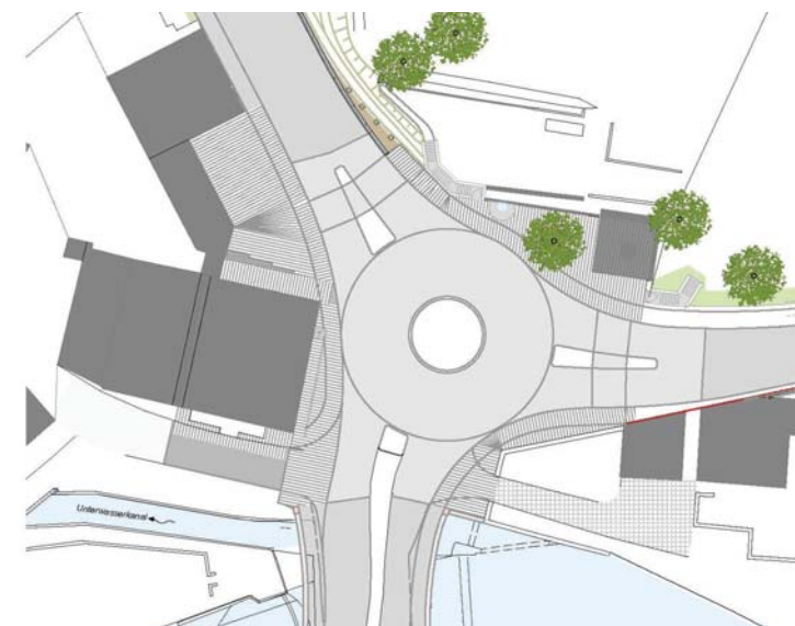
Detail Pflasterungsplan (Reihenpflasterung mit Richtungsvorgabe)